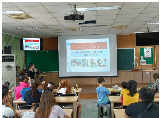
◆輔導主任說明學校有什麼家庭教育輔導資源。