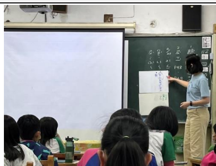
全班思考家的元素