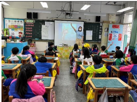
閱讀故事【我有兩個家】