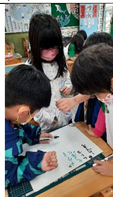
討論家有什麼元素