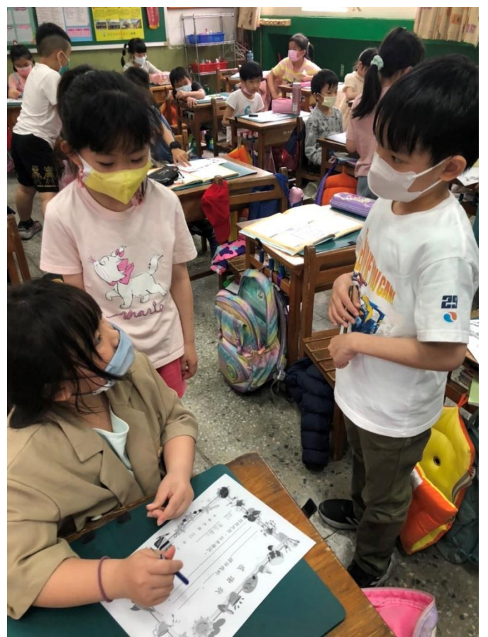
說明:討論家人對自己的付出有哪些