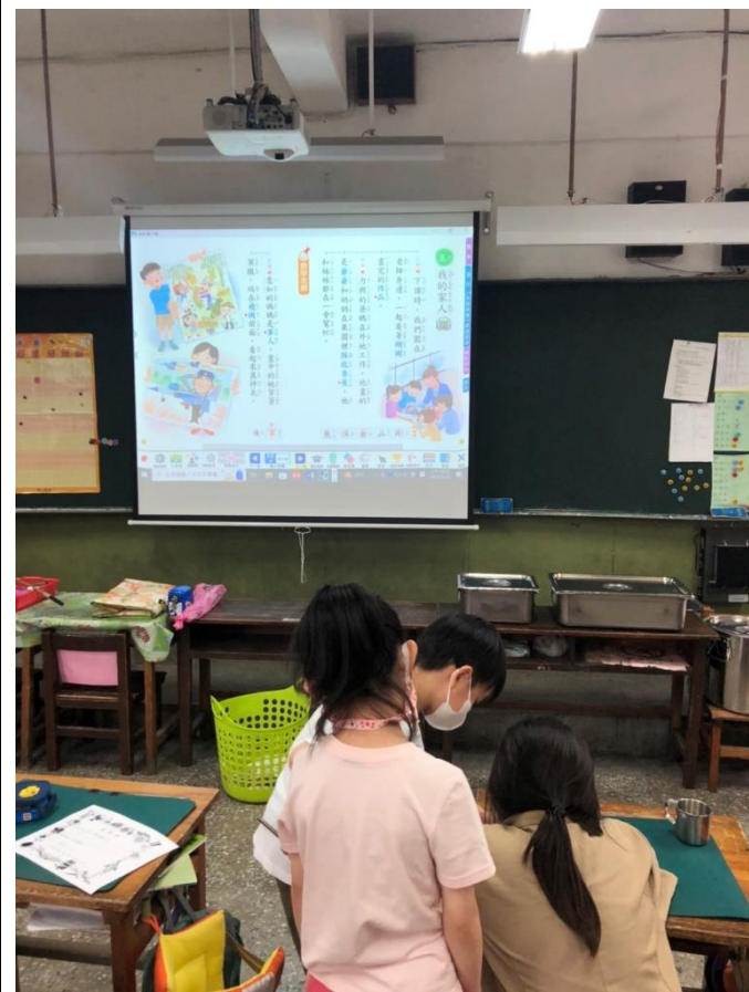
說明:結合國語課程~我的家人