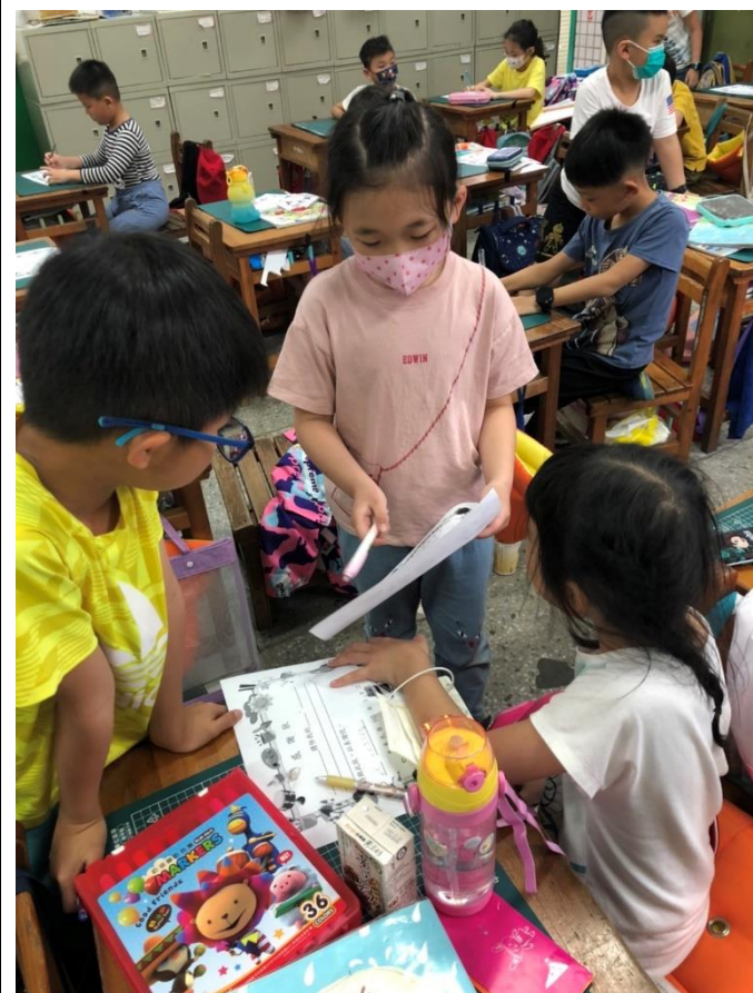
說明: 討論家人對自己的付出有哪些