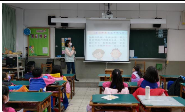
學生聆聽教師說故事