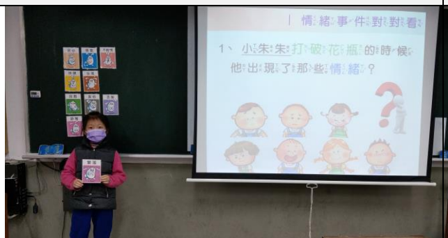
學生辨認故事中不同事件的情緒