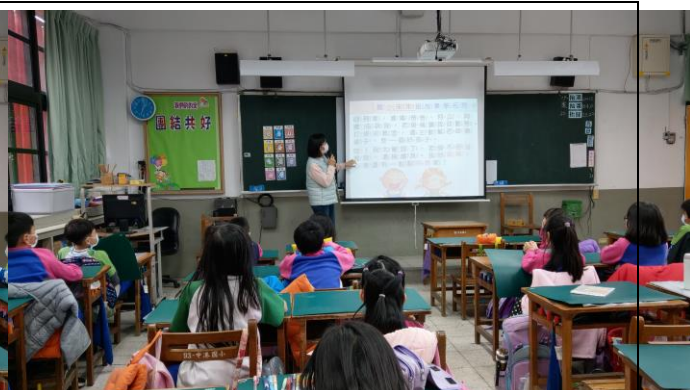
學生聆聽教師說故事