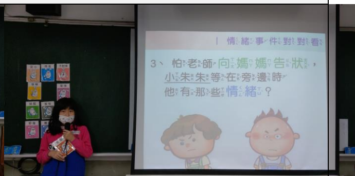
學生辨認故事中不同事件的情緒