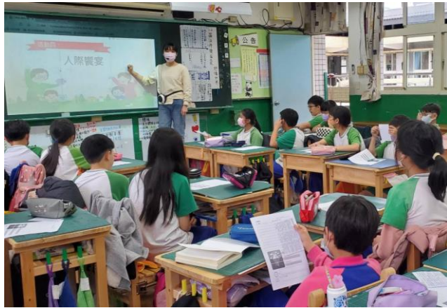
說明:家庭教育主題：人際饗宴—情緒冰山