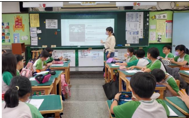
說明:如何運用薩提爾的冰山理論