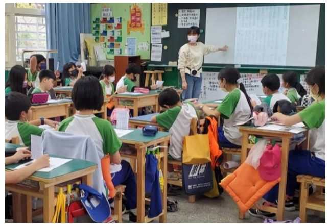
說明:共讀國語日報文章—惹怒好友。