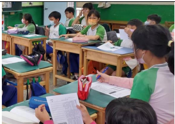
說明:學生反思自我的生活經驗