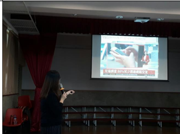
◆家庭是教導孩子正確感情價值觀最黃金時期。