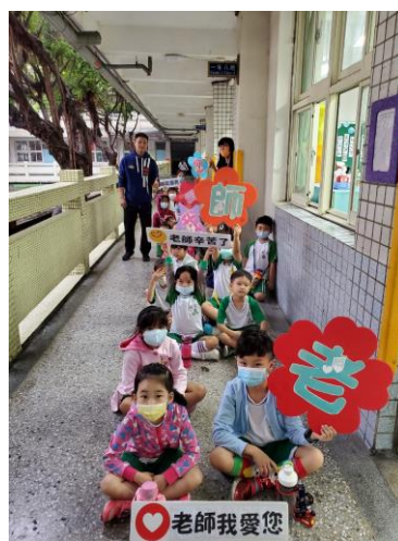
◆學生手語表演帶動孩子們感謝老師的心。