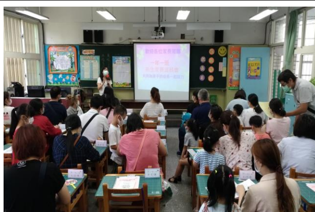
◆透過座談交流並充分溝通。