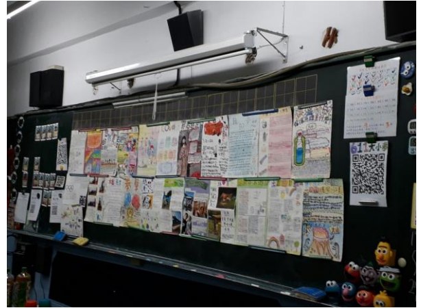
◆學生學習成果展現。