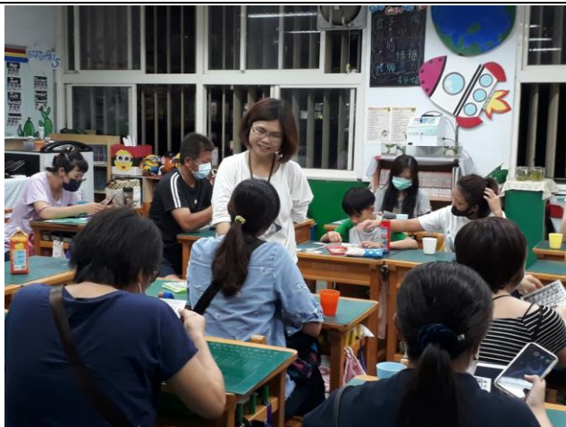
◆導師和家長共同討論學生的問題。