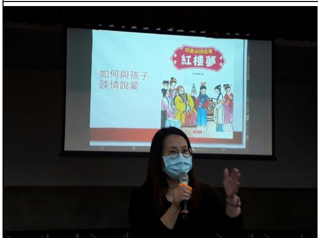
◆父母尊重與理解孩子，並且在必要的時候加以引導。