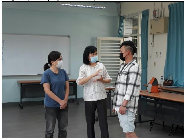
◆將與孩子相處的情境演出並分享和孩子相處的經驗。