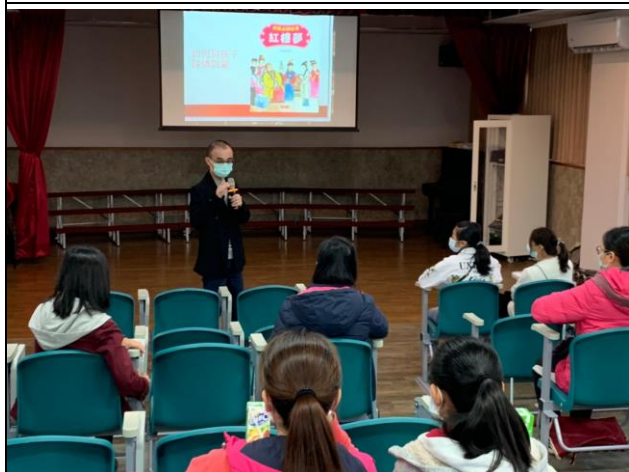
◆校長分享自己引導孩子的經驗。