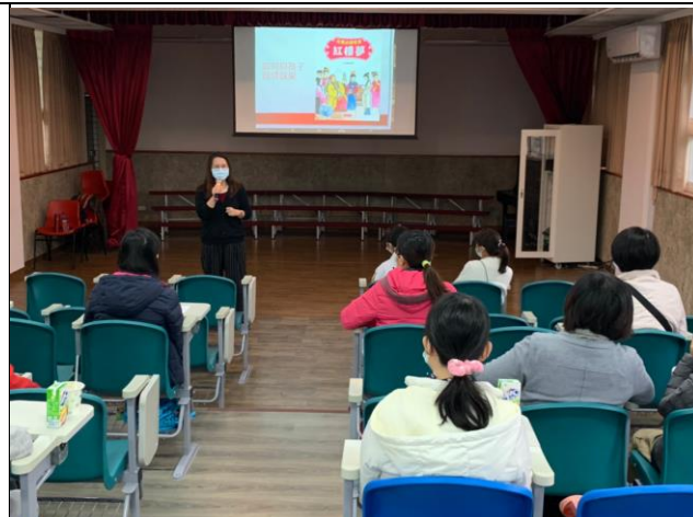
◆如果孩子在感情上受挫，我們會加以引導，告訴他們該如何尊重別人愛護自己。