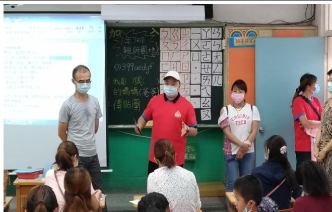
◆會長向家長說明親師合作的雙贏。