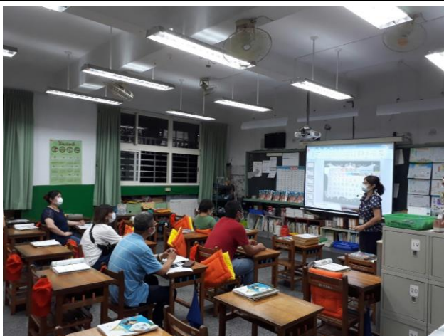
◆導師利用簡報向家長說明班級經營和教學理念。