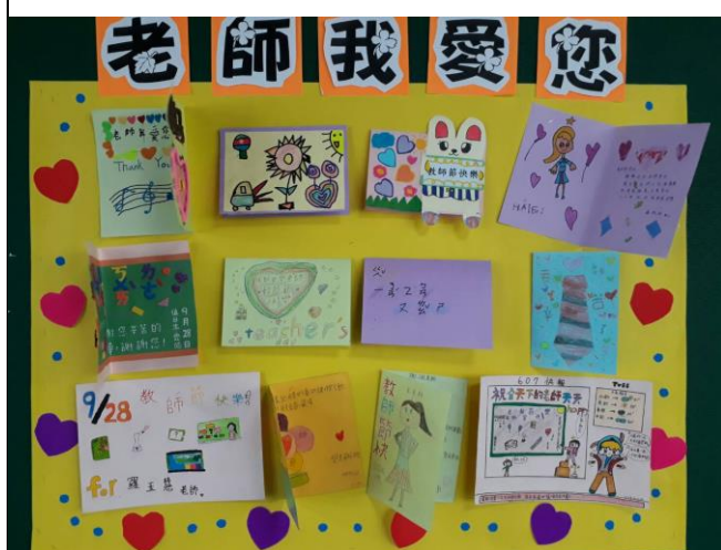
◆學生製作敬師卡感謝師恩。