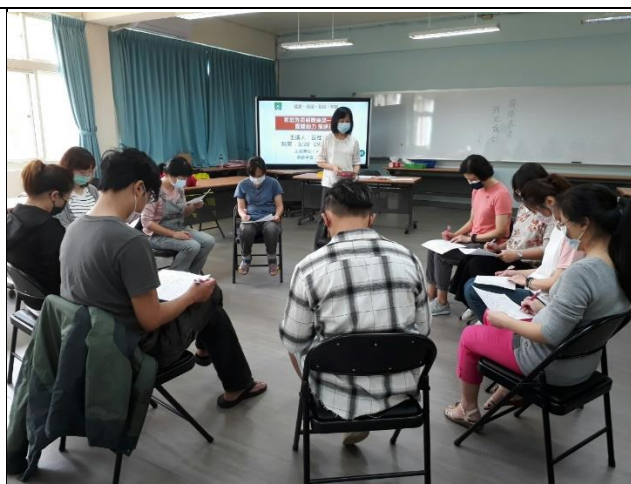
◆讓家長從題目中思考自己是否是慣爸爸或慣媽媽。