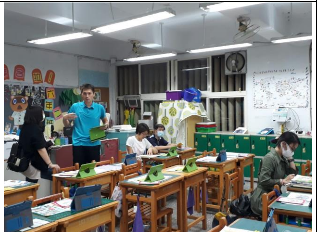
◆家長踴躍參與和導師做交流。