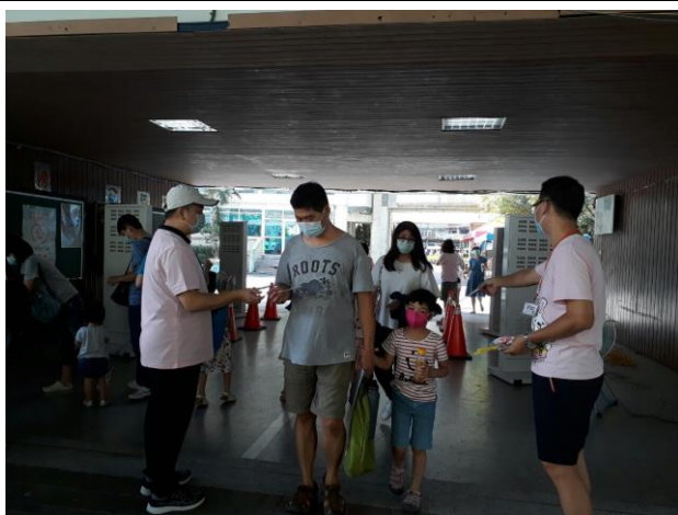
◆社團後援會熱情招生