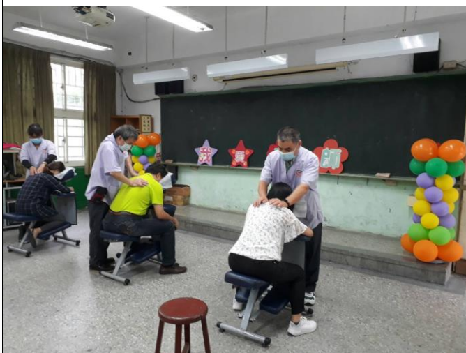
◆視障按摩師到校幫老師舒緩筋骨。