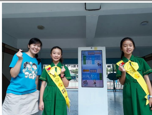
◆幼童軍引導新生家長認識環境。