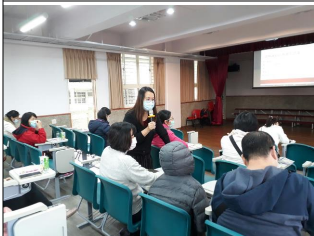
◆家長一同分享和孩子相處的經驗。