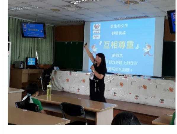
◆讓學童清楚認識子宮、輸卵管、卵巢等部位及功能。