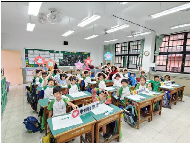
◆感謝老師的教導和關懷。