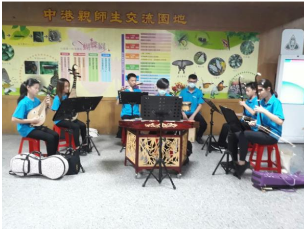
◆社團學習成果的呈現。

◆活動概述: 家長與老師們面對面的晤談，關心孩子的學習成長，用心於親師溝通，共同希望孩子們在未來展現自己的能力，邁向自己的理想。