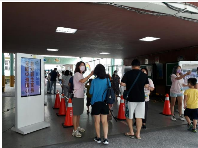
◆防疫期間入校量體溫戴口罩。

◆活動概述：透過新生班級親師交流，讓新生家長能更了解學校制度環境，協助新生適應新環境和幫助學習。