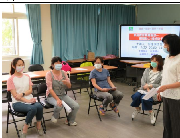
◆分享在聆聽家長描述孩子的行為時，有怎樣的感受或情緒。