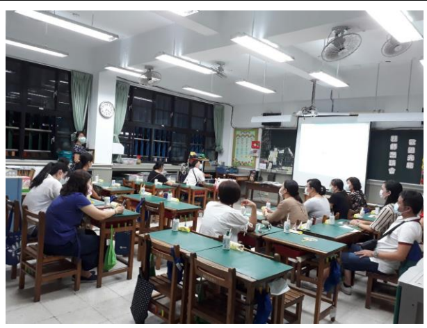
◆與家長共同討論學校事務的發展。