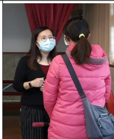
◆家長個別向講師諮詢。