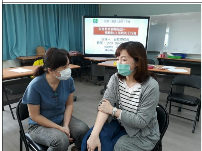
◆自己想像一個情境，應用「正負向語詞表」來描述孩子的行為給孩子聽。