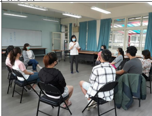
◆講師歸納重點說明花一點時間訓練，幫助孩子學習相互尊重和解決問題的技能。