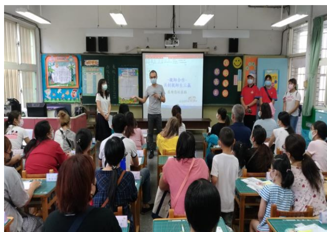
◆校長歡迎家長並說明學校事務。