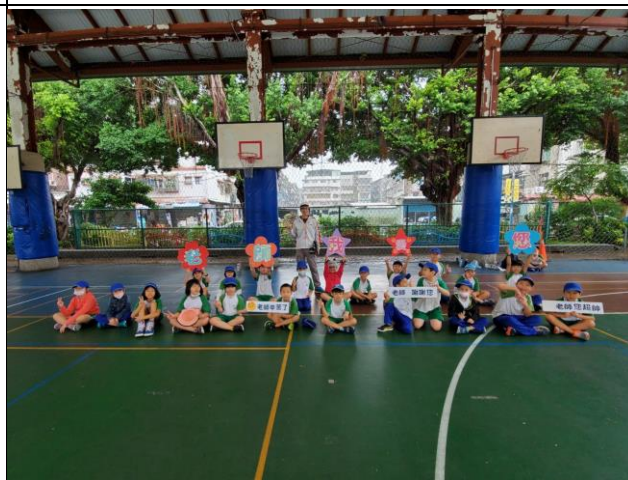
◆學生愛的宣言表達對老師的感謝。