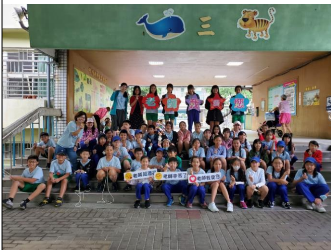
◆學生誠摯展現對老師的敬意。

◆活動概述:學生用愛的宣言、歌聲、手語、敬師卡表達出對老師的謝意，充滿溫馨和樂。視障按摩師到校幫老師舒緩筋骨，致上對老師的真誠的祝福和感謝。讓敬師活動不僅有感謝師恩的感動，還有深刻的教育意義。