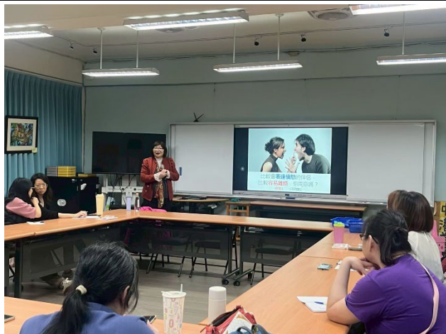
◆遇到壓力時該怎麼處理。