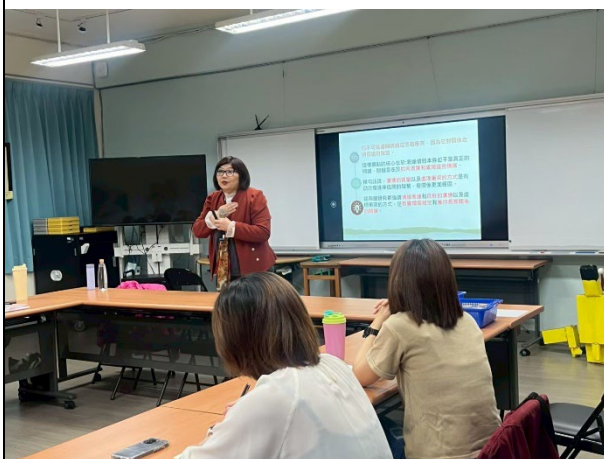
◆講師說明情緒如何影響夫妻相處