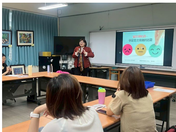
◆學習用友善的態度親近伴侶。