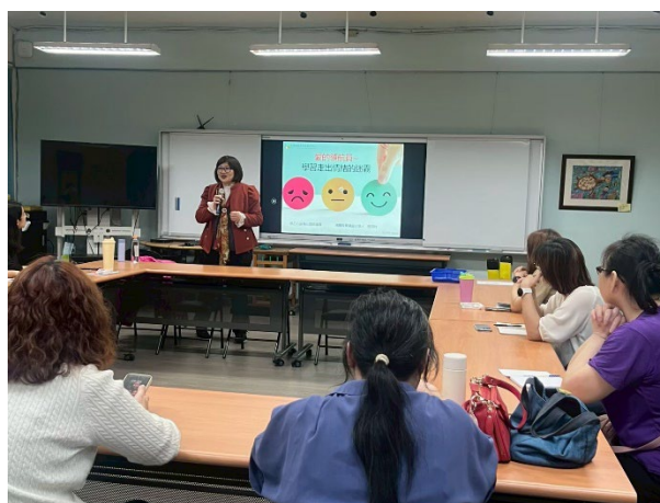
◆學習用友善的態度親近伴侶。