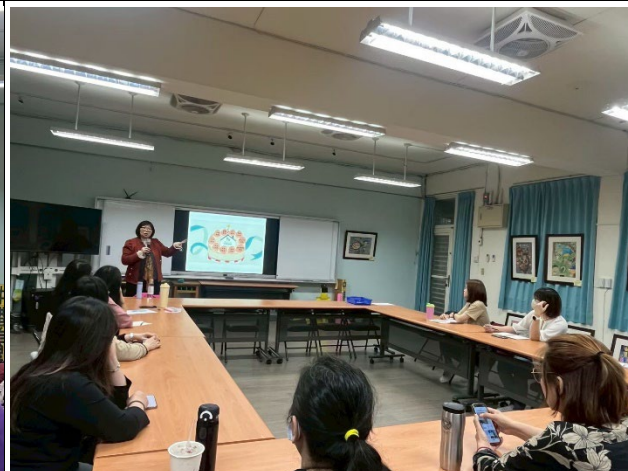
◆學習用友善的態度親近伴侶。