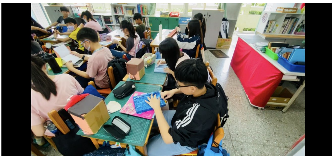
說明：閱讀書中的推薦序。