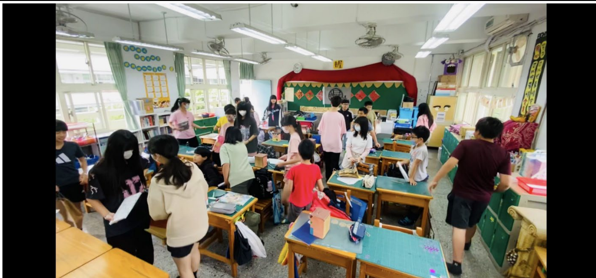
說明：學生進行交換禮物。